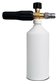
Пінокомплект із пластиковим бачком